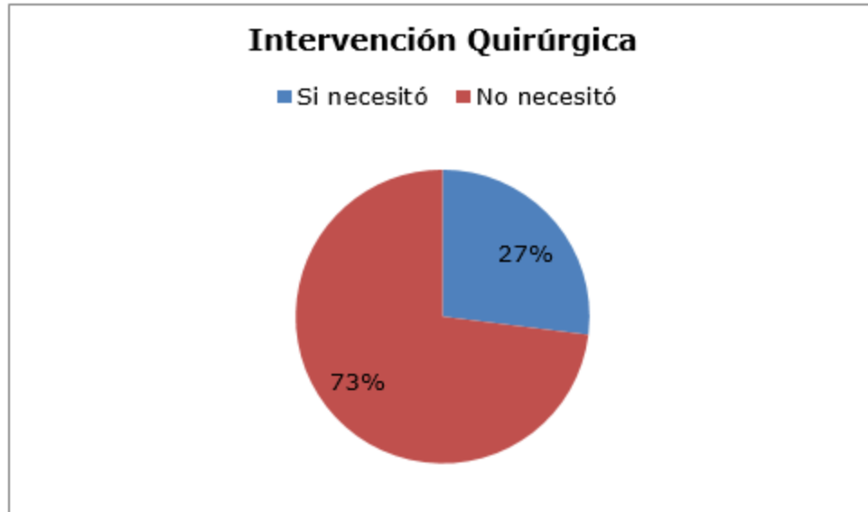
Fig. 2. Distribución en cuanto a la intervención quirúrgica.