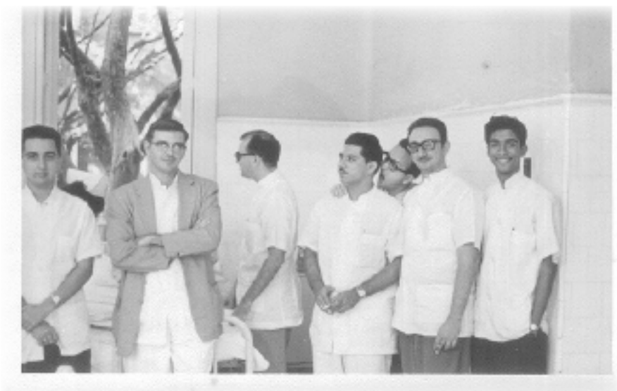
Figura 3. Realizando un pase de visita en la Sala Mestre del Calixto García (Tercero de izquierda a derecha, en la pielera de la cama del paciente).

Después del golpe del 10 de marzo de 1952 la vida en el país se transformó. Fueron años convulsos en Cuba y como el hospital no dependía del gobierno, se respiraba cierta libertad, allí existió una resistencia estudiantil a la dictadura y se trataron, curaron y operaron miembros de la lucha clandestina y del 26 de julio.