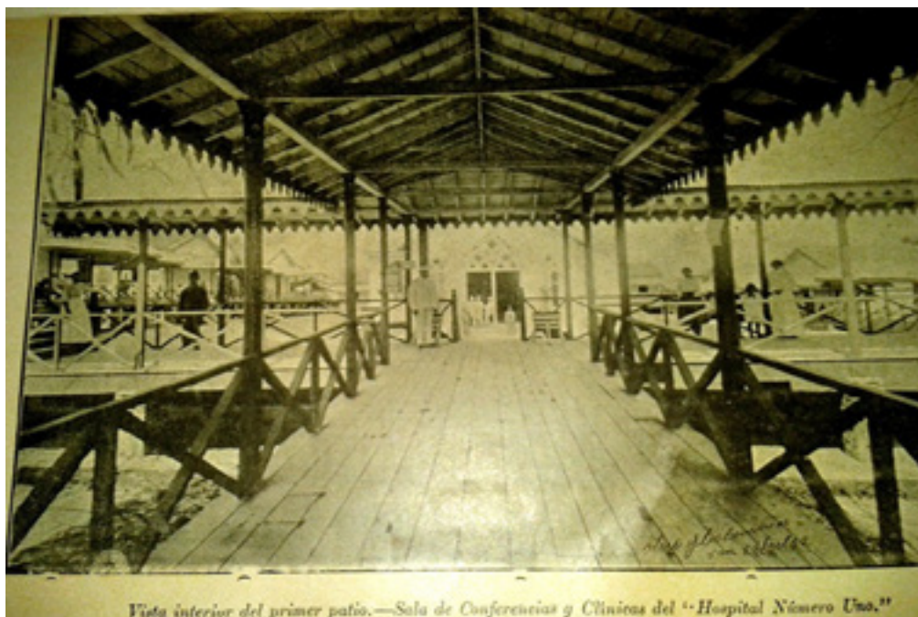
Figura 2. Al fondo del pasillo, la Sala de Conferencias y Clínicas.1903.

En 1903 se publicaron 14 números y se mantuvo la publicación hasta el año 1950. El sumario de la revista variaba en estructura, no era estable en todos los números. Incluía: