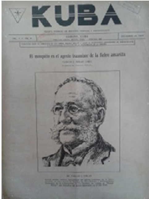
Figura 4. Volumen 1, Número 4 de la revista Kuba, dedicada a la figura y obra del Dr Carlos J. Finlay.