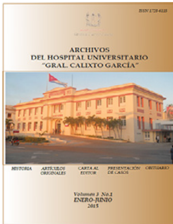
Figura 6. Archivos del Hospital Universitario "Gral. Calixto García". 2015

Paso 5.- Adecuación de la práctica clínica a las pruebas científicas. 13