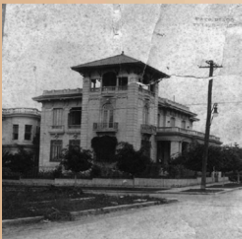
Su mansión en 19 y Paseo, en El Vedado, que entregara al Estado al triunfo revolucionario, yendo a vivir a una casa en Miramar, en buenas condiciones; pero mucho más sencilla.

Unida a esta brillante trayectoria como médico, cirujano, profesor y directivo, está la del miliciano, realizando sus ejercicios de preparación combativa, sus guardias y participando en las movilizaciones