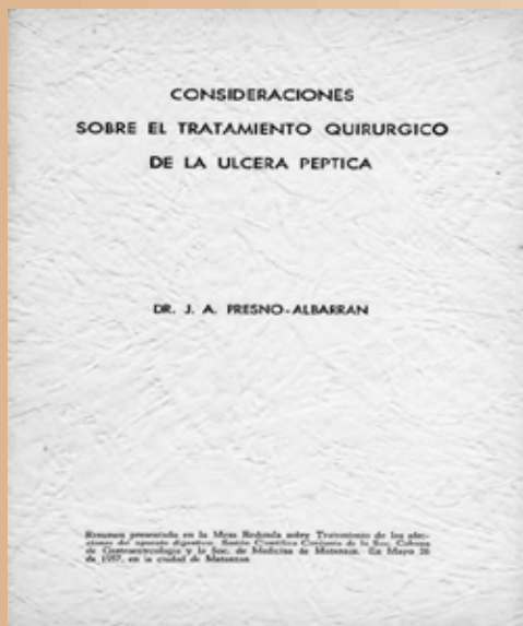
Tema al que le dedicara años de estudio, presentado en una Mesa Redonda en la Sesión Conjunta de la Sociedad Cubana de Gastroenterología y la Sociedad de Medicina, en Matanzas.

militares; y la del trabajador consciente de la importancia de su participación en la Asamblea Sindical y en el Trabajo Voluntario, actividades durante las cuales confraternizaba con todos los trabajadores, con la sencillez y la simpatía de cubano legítimo que lo caracterizaban.