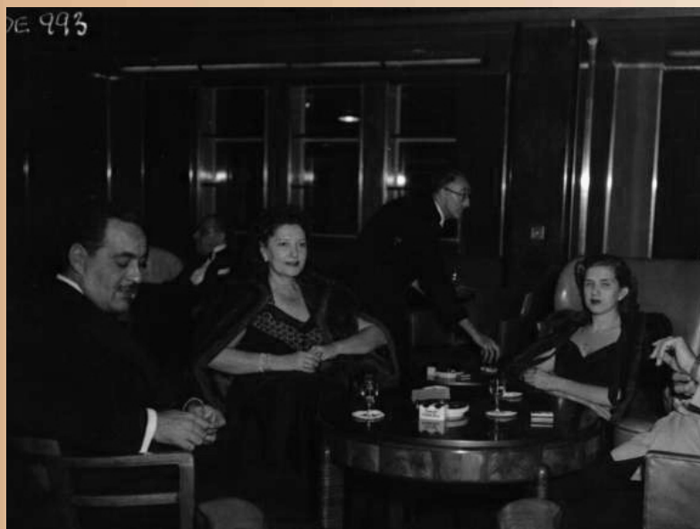
En el yate Queen Elizabeth, en su viaje de bodas.

El alto nivel de su compromiso social le mueve a aceptar en el período 1962 - 63, el Vicedecanato de la Facultad de Medicina y en el período 1963 - 64 asumió las funciones de Decano. Fue miembro del Consejo de la Facultad, responsable de superación profesoral y miembro de